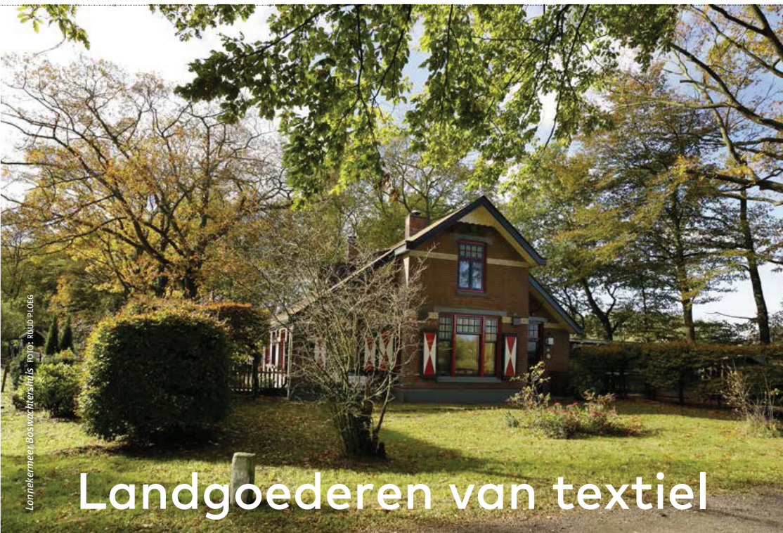
Lonnekermeer, Boswachtershuis